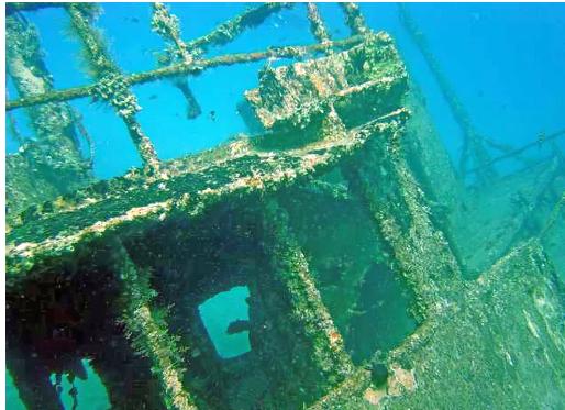
Wrak van de Limon.

Deze oude sleepboot is bijna 29m (115ft) lang en rust op 26m (80ft) diepte niet ver van de “Hickory” in hetzelfde park. Het schip werd er gekelderd om dezelfde reden, het dienen als toeristische attractie. De diepte waar deze