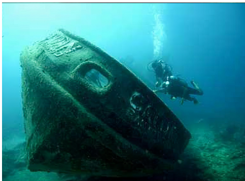
Wrak van de Catuan.