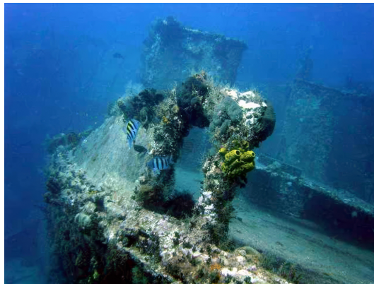
Fauna en flora op het wrak van de Hickory.

De “Hickory” was een beroemd onderzoek- en bergingsschip gebruikt van Kapt. Tracy Bowden en zijn bemanning in de jaren '70. Het werd gebruikt om scheepswrakken te lokaliseren langs de noordkust van de Dominicaanse Republiek.