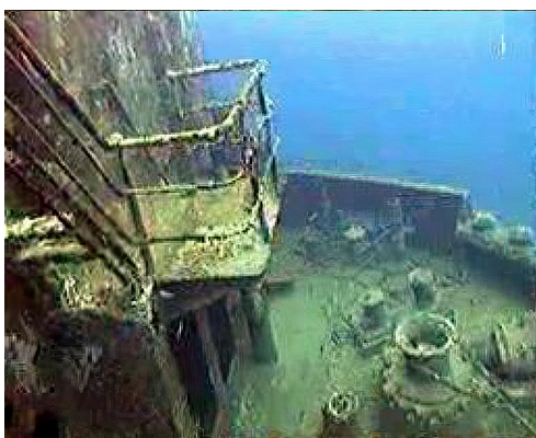
De restanten van de St. George.

Oorspronkelijk heette dit schip M.V. Norbrae en werd gebouwd in 1962 in Strathclyde, Schotland. Het schip vervoerde graan en gerst over de Atlantische Oceaan tussen Noorwegen en de Verenigde Staten. Na twintig jaar dienst werd het in de haven van Puerto Plata verlaten. Het werd tot zinken gebracht als een artificieel rif in 1999. Dit opmerkelijk stalen schip met een lengte van 80m (262ft) is dicht bij het toeristisch dorpje Bayahibe, ten oosten van Santo Domingo, te vinden. Nadat de orkaan George passeerde in 1986 en de romp van het schip rukte, kreeg het de naam St. George. Het schip, oorspronkelijk een vrachtschip, rust rechtop en de bovenbouw is op 32m (104ft) diepte. Het diepste gedeelte van de romp ligt op een 55m (180ft). Er zijn twee markeerboeien. Eentje aan de boeg en de andere aan het achtersteven. Meer ervaren duikers kunnen in het wrak binnendringen. In de grote cargoruimte waar zich een reusachtige messingschroef, pompen, warmtekanonnen en een motor bevinden kunnen ze doorzwemmen. Drie etages met crewcabines en de brug kunnen ook verkend worden. Dit scheepswrak is een zeer populaire duikbestemming recht tegenover het strand van Bayahibe.