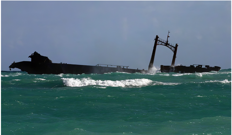
De golven die tegen de overblijfselen van de Astron beuken.