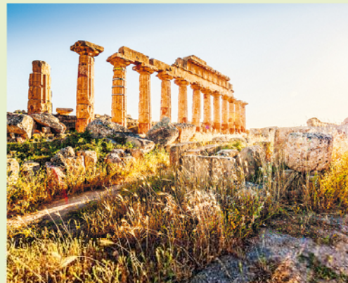
Tempel C is een van de vier tempels van de akropolis van Selinunte. Een paar zuilen zijn weer overeind gezet.

Met zijn krap 1000 inwoners kan het huidige Marinella di Selinunte niet tippen aan de antieke stad Selinus, die van tijd tot tijd meer dan 100.000 inwoners telde. Een vruchtbare bodem, twee natuurlijke havens en overvloedig zoet water waren rond 628 v.Chr. voldoende redenen voor kolonisten uit Megara Hyblaia om op deze locatie een nederzetting te stichten, de meest westelijk gelegen Griekse buitenpost op Sicilië. Zijn bloeitijd beleef-