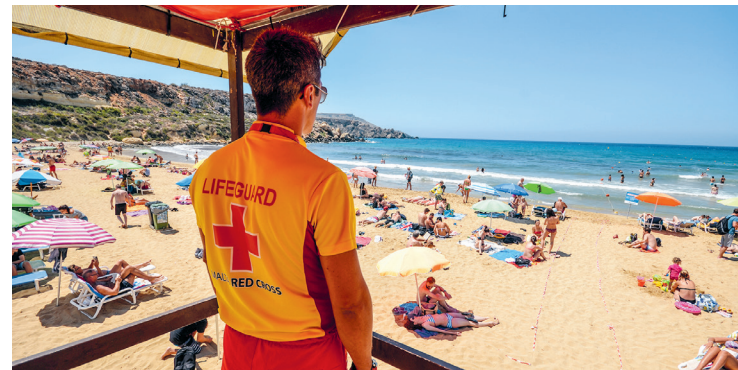
De zon bakt, de lifeguard let op en het zand schittert als goud. Daarom heet de baai ook Golden Bay en is het het beste strand van Malta

Munchies Golden Bay Sinds de populaire strandkiosk is afgebroken serveert men strandgangers goedkope snacks in een nieuw gebouw bij de parkeerplaats. Dresscode: badkleding. Op de bovenverdieping met terras gaat het er gedistingeerder aan toe; in het laagseizoen (okt.-mei) opent hier een hippe eetgelegenheden met een topzicht en Italiaanse keuken de deuren.