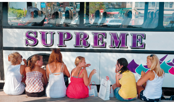
Shopper kan prima in Sliema, al zijn deze jongedames er waarschijnlijk eigenlijk om Engels te leren

Dat geldt in elk geval voor de wijk Paceville aan St. George's Bay , waar de gemiddelde leeftijd nauwelijks boven de 25 jaar ligt. 's Avonds is er tussen de bars en clubs bijna geen doorkomen aan. Chiquer en eleganter is het aan de voet van Portomaso Tower , die met zijn 98 m boven het Hiltonhotel (met jachthaven) en deftige restaurants uitsteekt. En er zijn al nieuwe torens in aanbouw! Bijzonder schilderachtig, als het er niet overschouwd zou zijn, is Spinola Bay . Bontgekleurde vissersboten wagen er op het