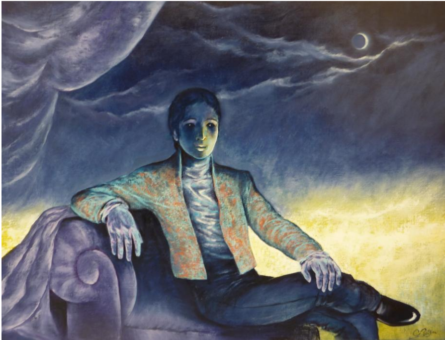
L'Aristocrate - De aristocraat Privécollectie - Lucifernum

verdict was kordaat, kamerarrest. “Dat is geen volk voor ons,” had ze gezegd. In haar ogen fonkelde dezelfde nieuwsgierigheid als in de zijne. Alleen had zij geleerd om ze netjes te camoufleren onder morele afkeuring. Nu is hij volwassen, op papier dan toch en moet hij toegeven, veel van haar techniek heeft hij overgenomen. Zijn oom waar hij rotsvast naar opkeek en die hij nonkel noemt, trad haar bij. Soit, we dwalen af.