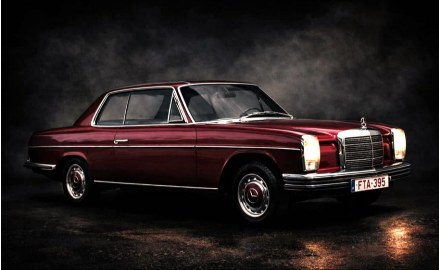
Mercedes 250C/8 coupé uit 1969

de een of andere manier moest de duif, toen hij wat uit de dons was gegroeid en leerde vliegen, een kleine, zeg maar aanloop nemen alvorens hij het luchtruim kon bevliegen. Maar ze hadden ook een hond, Boris was z'n naam. Борис in het Russisch. Nonkel sprak dat uit als Baris . Boris was een speelse boxer die het goed kon vinden bij hun thuis met drie kinderen. Boris was energiek en dat was ook niet zonder de duif gerekend die plots tussen Boris' tanden terecht was gekomen. De duif die buiten Boris' wil kennelijk een doodstrijd leverde tot wanneer de drie broers thuis kwamen van school. Moeder gilde, Boris schrok, liet de duif abrupt uit m'n muil op de grond vallen. De duif gaf nog enkele naschokken. Z'n broer troostte zich met de woorden: "Dat is de wet van de natuur, de wil van God."