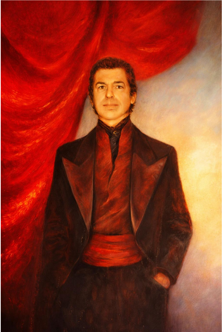
Doctor Retsin Privécollectie – Luciferum