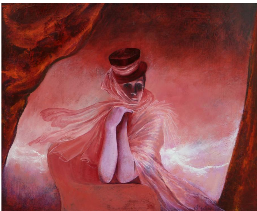
La Vénitienne, Dame des Canaux - De Venetiaanse, Vrouwe der Reien Privécollectie – Lucifernum

Hij flaneert verder. Het lied in zijn oren. Een glimlach om zijn lippen met ergens in zijn achterhoofd het absurde, tedere besef: Soms komt de tulp niet uit Amsterdam. Maar de droom wel.