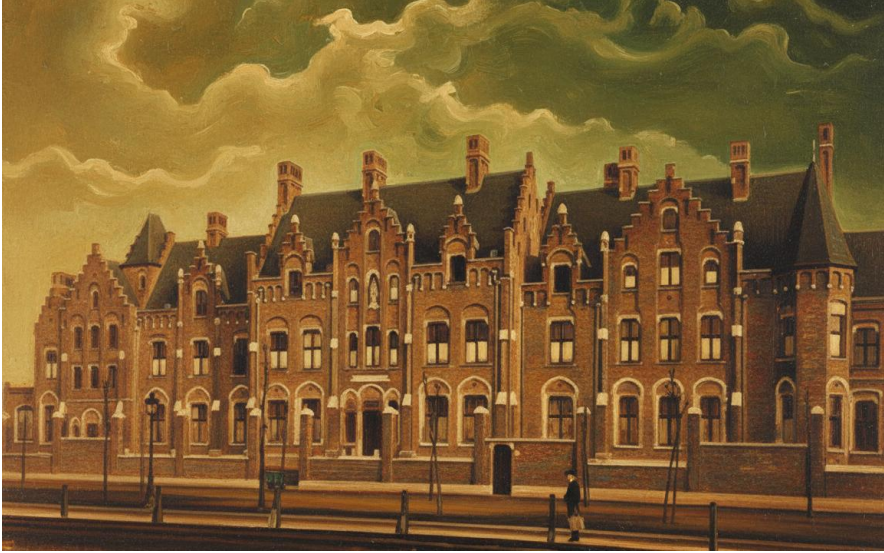
Brugge, Hôpital des Sœurs Augustines de Meaux. 1904

Hij informeert dus, soms. Kalm, kort. Als één zin niet volstaat, zal het niet lukken. En dan wijkt de weerstand, alsof een deur die eerst weigerde nu vanzelf opengaat of andersom.