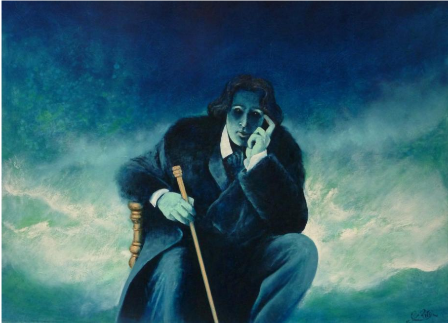
Oscar Wilde Privécollectie – Lucifernum

*Wij liggen allemaal in de goot, maar sommigen van ons, kijken naar de sterren.