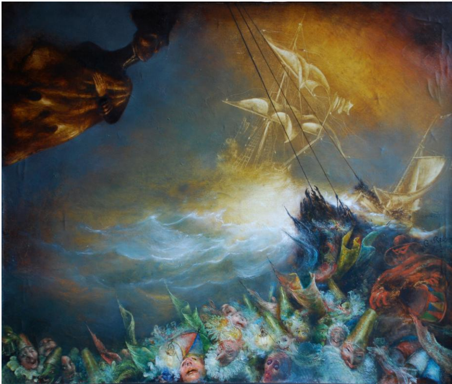
La Tempête des Illusions - De Storm der Wanen Privécollectie – Luciferum