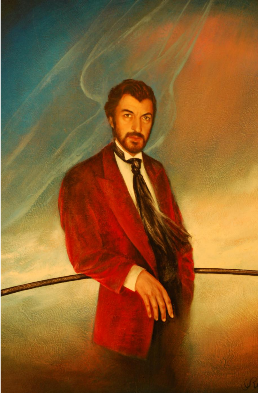
Maître de l'Ombre, Gilbert Retsin Privécollectie – Lucifernum